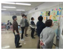
▲前回こんなことやったんだ