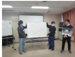
▲お昼前はこんなことをやりました！