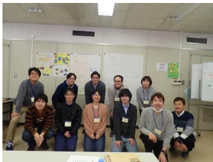
▲ハイポーズ！（1、2、パシャ！）