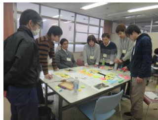
▲むずかしいなあ・・・▼