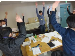
▲実施計画作りの前に皆で体操をしました。眠気もすっきり！