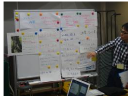
▲▲ 経営者会議でプレゼンテーション本番。…緊張しました。