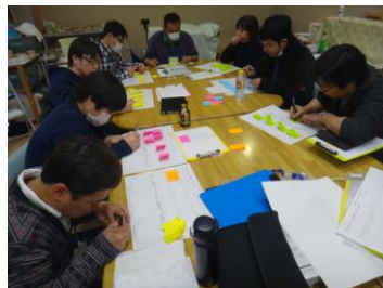
▲最後は研修の振り返り