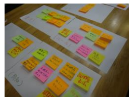
▲▲ 実施にあたり決めなければいけないことを付箋に書き出し話し合いをしました。