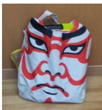
▲次回開催施設の職員が持ち帰る道具袋。まるで罰ゲーム…

次回はリハーサルで分かった事から、7 月の「にやりほっと」本番のオペレーションについて検討していきます。今回より、もっと濃い内容になりそうです。皆様に楽しんで参加頂けるよう頑張っていきますので、もしばらくお待ちください。