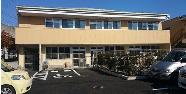
▲3 作業所が一体化した「こまえ工房」